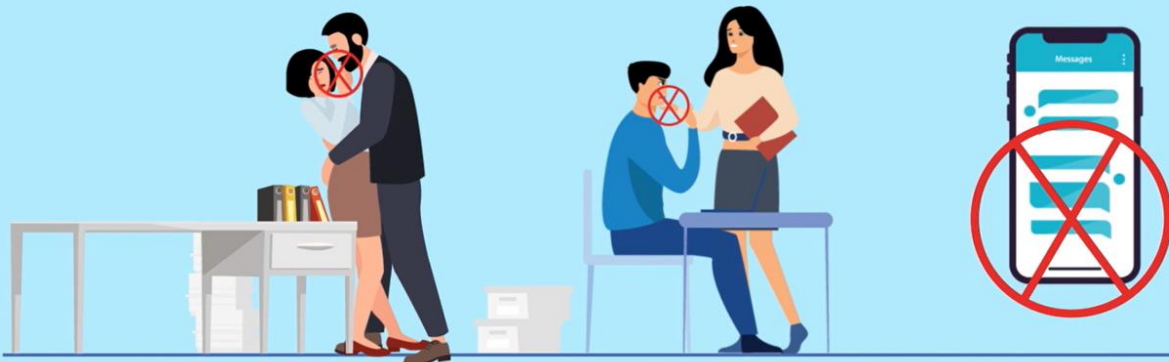
VỀ THỂ CHẤT

Bộ luật Lao động năm 2019 đã đưa ra Khái niệm cụ thể về Hành vi quấy rối tình dục tại nơi làm việc là hành vi có tính chất tình dục của bất kỳ người nào đối với người khác mà không được người đó mong muốn hoặc chấp nhận.